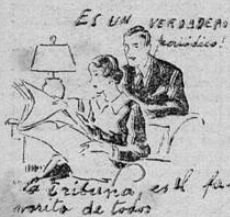
ES UN VERDADERO romance!

Concurso organizado por NOVEDADES — El acontecimiento social de 1937